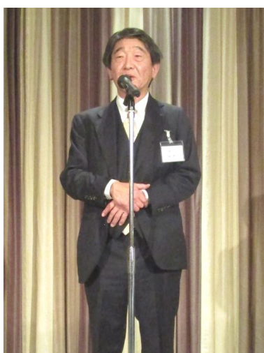
林 会長 ご挨拶