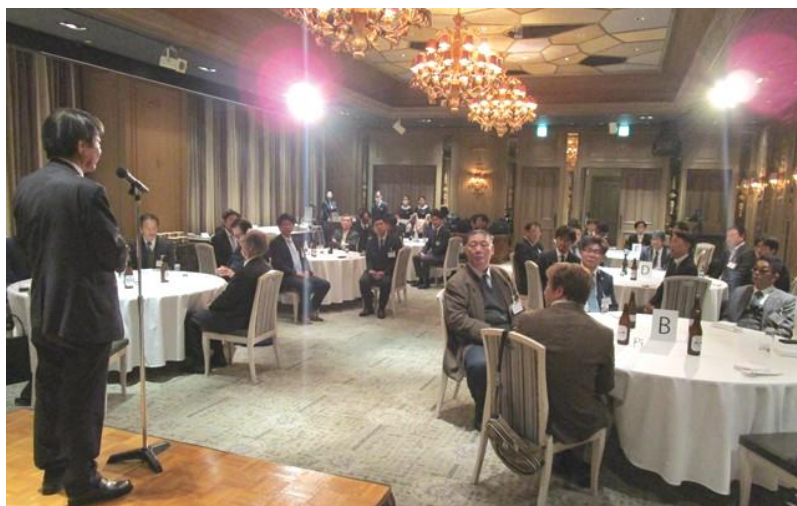
忘年会 会場の全景