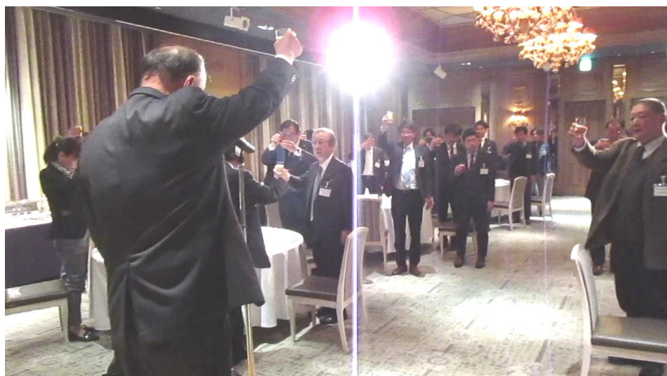
関副会長による 乾杯のご発声