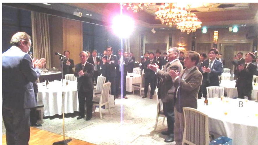
西村副会長による閉宴のご挨拶、最後は一本締め

大抽選会の後もしばらくはご歓談頂いて美味しい料理とお酒で楽しいひと時をお過ごしいただきました。