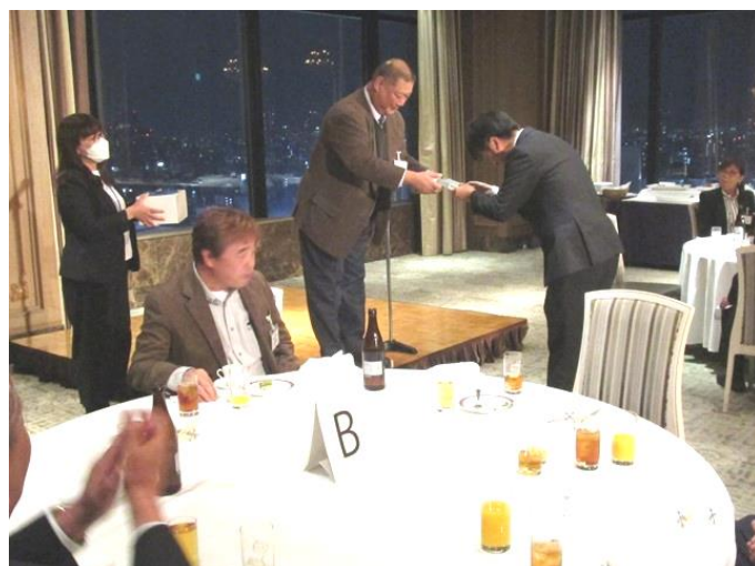
当選した方へ賞品の贈呈

賞品は、ウイスキー（山崎 12 年など計 3 本）、イワタニ製やきにくグリル器、イワタニ製炉ばた焼き器、マキタ掃除機、象印製品（2 商品）、パナソニック製シェーバー（3 商品）、女性用ハンドバッグなど豪華な賞品が合計 12 品もありました。参加者は 38 名でしたので、当選確率は約 1/3 という高確率でした。当選された方は贈呈式をした後に壇上でひと言喜びのお声を頂きました。皆様大変喜んでおられる様子でした。