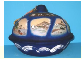
近江八景土鈴 志摩 鈴ミュージアム 所蔵

2012年 5月2日～7月30日までの 毎水曜、土曜、祝日のご出発に限り、 近鉄特急往復旅費・乗船券・美術館入館料・1泊4食豪華夕食付きの志摩の旅！