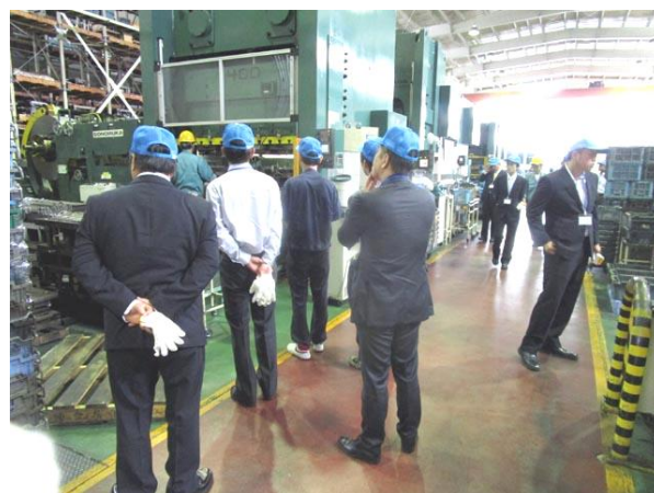
阪口製作所様の工場内見学風景