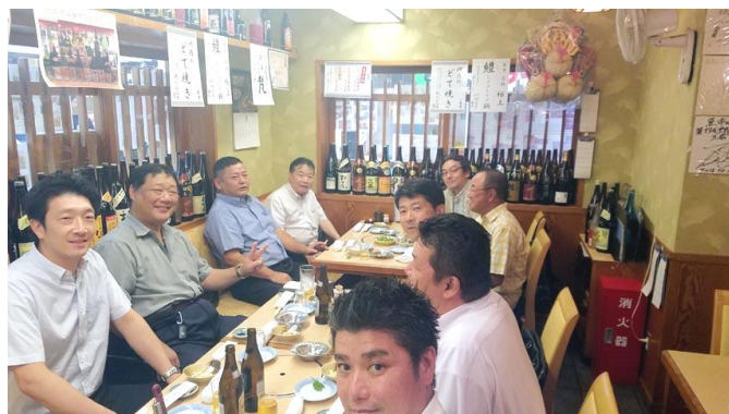
< 8月 現役・OB 合同交流会 8/18 12名 >