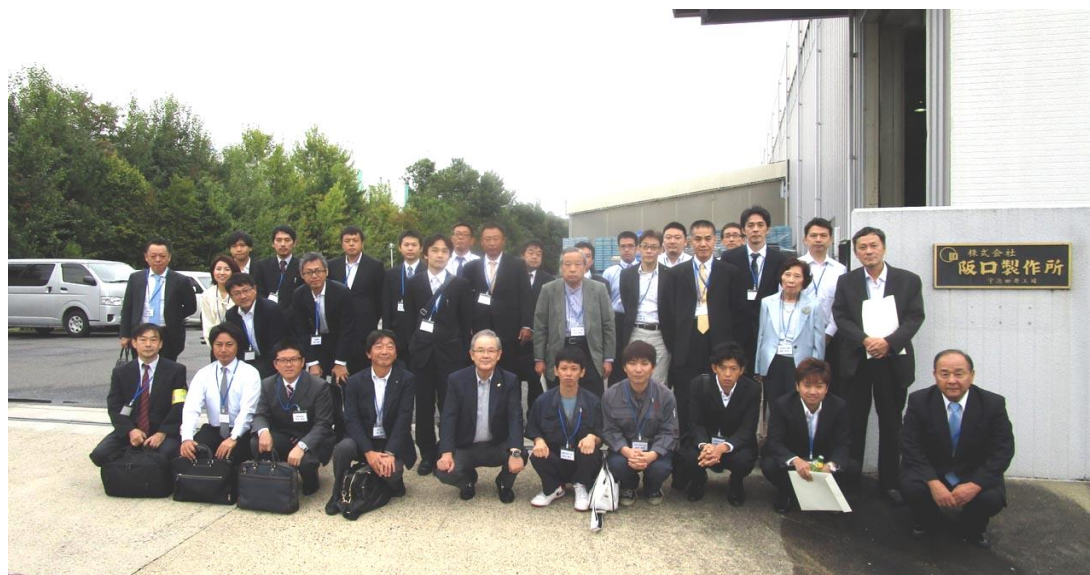
阪口製作所様の前で記念撮影