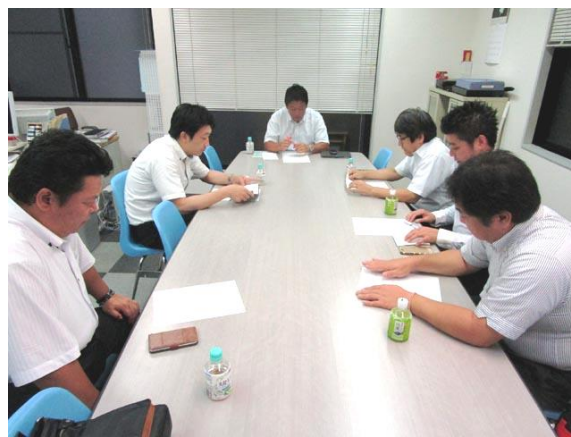
< 7月例会 7/11 6名 >