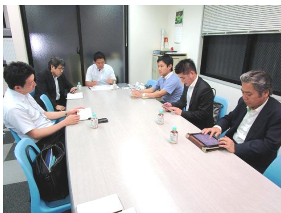
< 6月例会 6/15 6名 >

次代を担う若手経営者及び経営幹部の活動の場として青年部が活動を行なっております。青年部で毎月企画する事業活動（情報交換会、講演会、セミナー、見学会など）を通じて、識見・教養を高め、また家族会や他地区の青年部会との交流会などで会員相互の親睦を深めて頂く場としてご利用頂いています。