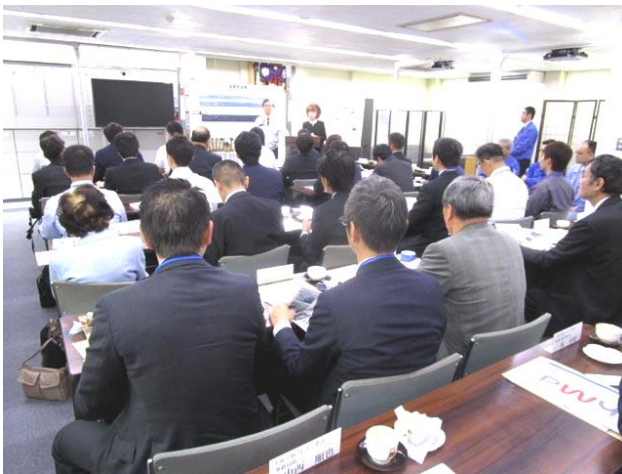
濱田プレス工藝様の会社説明

質疑応答では社員教育に関するお話もあり、従業員の技能向上への取組み、また原価に上乗せ出来ない残業をゼロにする取組みもご紹介頂き、従業員のモチベーションも高いと感じました。