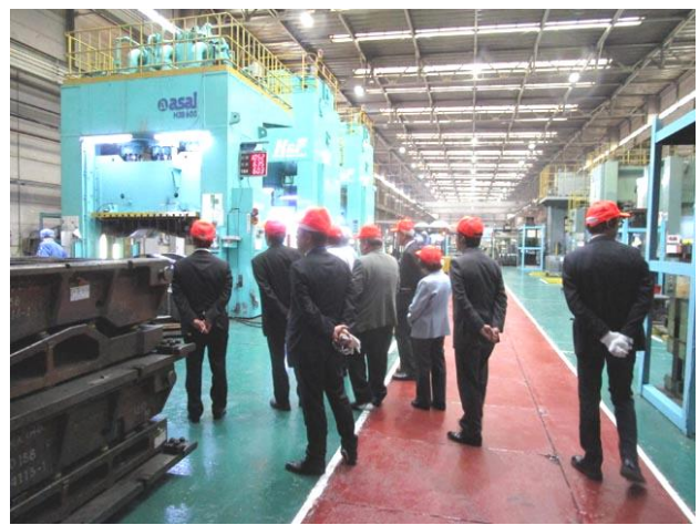
濱田プレス工藝様の工場見学風景