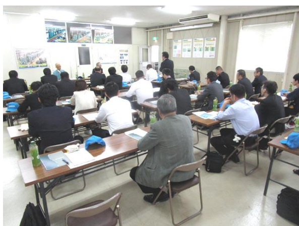
阪口製作所様の会社説明・質疑応答

昨年創業70周年を迎えられ、品質最優先をモットーに100年続く企業を目指し従業員一丸となって取り組まれています。プレス機はサーボプレス化計画を掲げられ、各メーカーのサーボプレス機をその特徴に応じて使い分けておられます。サーボプレスに切り替えることにより金型の寿命も大きく延ばし、複雑な加工も可能となりサーボプレス機を十分に使いこなされておられます。工場見学においては「隠し事はしないのでどこでも見て下さい」と阪口会長のお言葉を頂き、参加者は各自見たいところを十分に見学させて頂き、質疑応答をさせて頂きました。