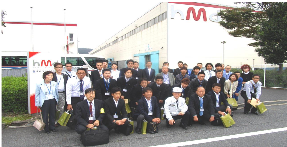
濱田プレス工藝様の前で記念撮影