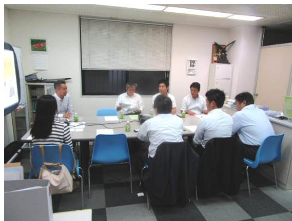
< 9月 講師例会 9/12 7名 >