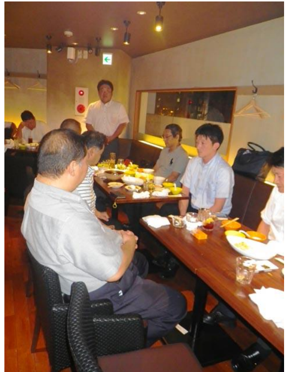
< 8月 現役・OB 合同交流会 8/3 15名 >

5月26日開催された創立50周年記念式典及び祝賀会では青年部が中心となり準備段階から企画、運営までを行ないました。8月は恒例になっています青年部現役とOBとの合同交流会を行ないました。また来る10月には愛知県及び京都府の金属プレス工業会青年部との合同交流会を予定しています。