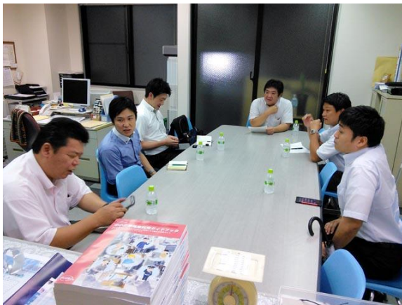
< 6月例会 6/24 6名 >

次代を担う若手経営者及び経営幹部の活動の場として青年部が活動を行なっております。青年部で毎月企画する事業活動（情報交換会、講演会、セミナー、見学会など）を通じて、識見・教養を高め、また家族会や他地区の青年部会との交流会などで会員相互の親睦を深めて頂く場としてご利用頂いています。