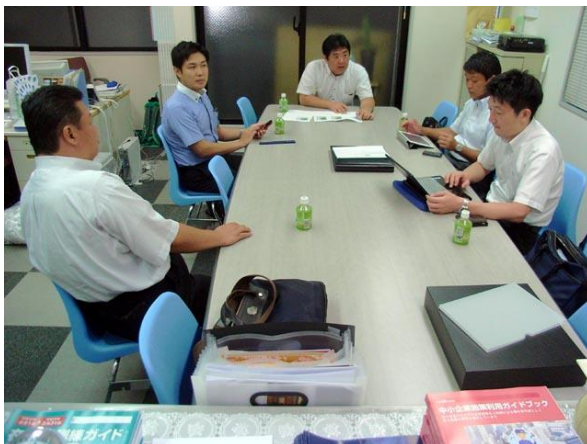
< 7月例会 7/26 5名 >