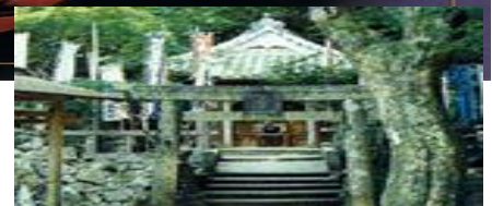
志摩のパワースポット 参拝 弘法大師ゆかりの『爪切不動尊』

シルクロードの華「玉宝」や 世界最大級の本真珠鮎雄雄一対 藤本能道他人間国宝の「陶芸」作品 を堪能 大山玉宝美術館 鑑賞